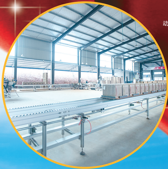
中洲烟花自动化生产车间。