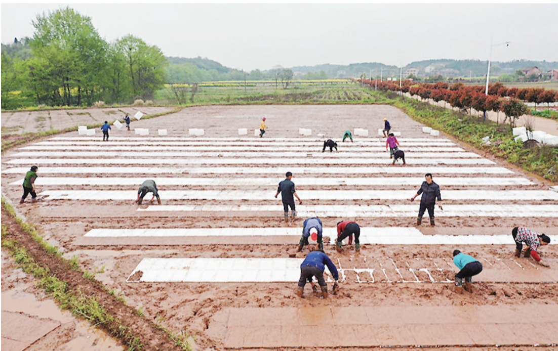
村民正在田间忙着集中育秧。

据人民网 一年之计在于春,眼下正是早稻备耕时节。3月中旬,湖南省衡阳县西渡镇福星村早稻集中育秧点一片忙碌的景象,运秧盘、铺秧盘、覆土、播种……30多位村民抢抓农时正在有条不紊地忙碌着。