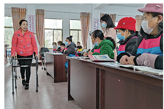
▲在姚家坝村村部,培训老师正在讲解养老护理的知识

今年以来,白关镇共有1000余名村民参加职业技能培训,包括面点烹饪、农业实用技术培训、家政电商以及养老护理、母婴保健等多个领域。组织职业技能培训26场,共为56家企业发布岗位需求1271个,达成求职意向369人。