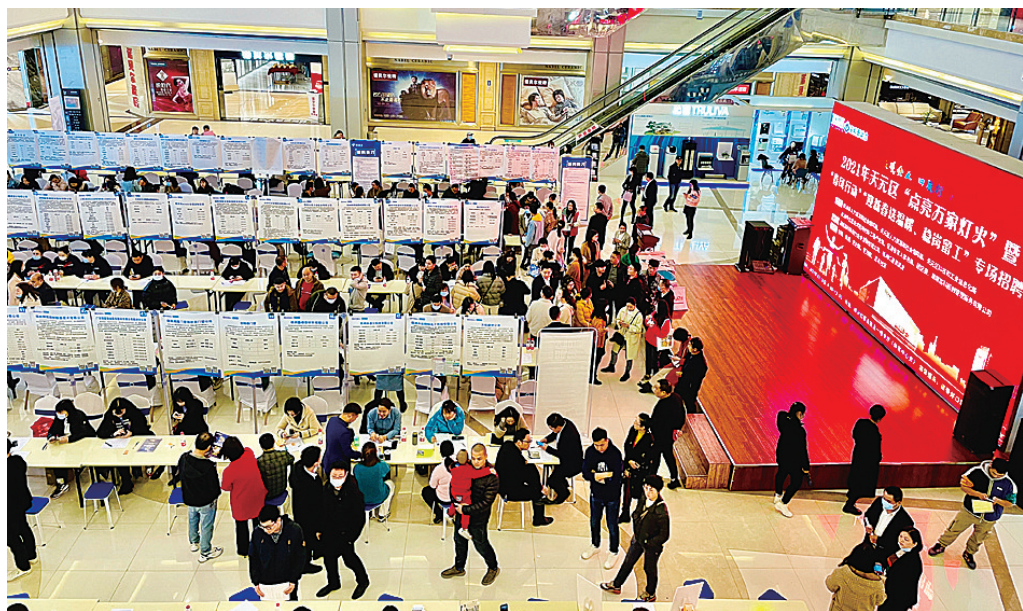
▲天元区专场招聘会现场