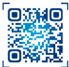
▲诸事达APP人才招聘模块二维码