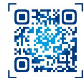
▲株洲市政府公共就业服务平台二维码

春风年年起,今时更不同。眼下,脱贫攻坚已经取得全面胜利,又迎来乡村振兴的接力棒,为全市高质量发展提供更多人才保障,“稳就业”,首当其冲。 在这个柳绿花开的时节,全市各级人社部门早部署、广覆盖、快行动,“实打实”全方位服务送暖心,“手把手”技能提升服务送安心,“心连心”稳岗服务送放心,想方设法破解企业用工、求职者找工作难题。 可以看到,全市上下各类招聘会正开得如火如荼,一场场招聘会进社区、进园区、深入乡镇、村庄,“点对点”发布用工信息,“面对面”开展招聘服务,提供从家门口直通厂门口的就业专车等系列精准服务,让忙着淘工作的农民工在家乡多了份乐业的浓浓暖意。 此外,由于疫情阴霾并未完全消散,特殊背景下,我市创新开出服务“妙方”,发起“春风行动”线上旋风,开辟云端专场招聘会,开展网络招聘、远程面试、直播带岗、职业指导等对接服务,让好岗位触“网”可及,真正让这股春风吹进求职者的心坎上。