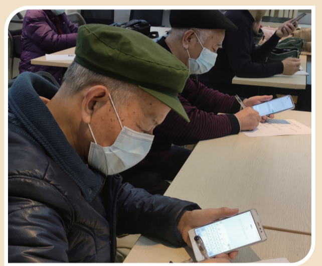
▲智能手机课,学员认真做笔记