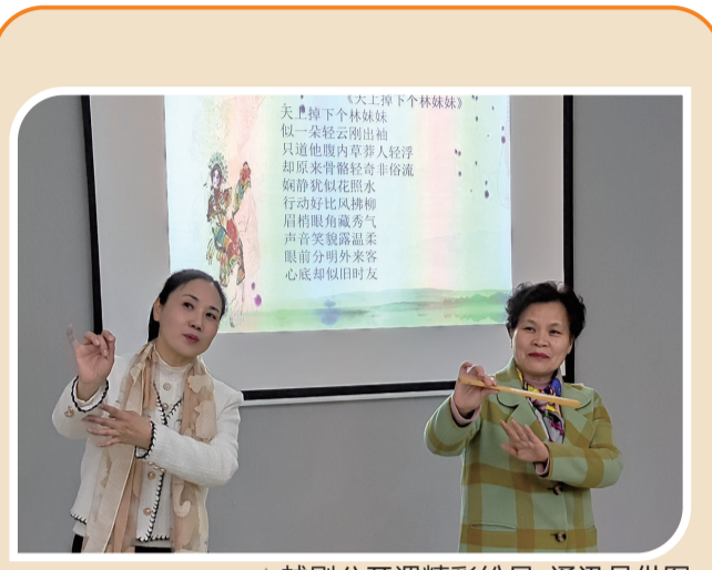
▲越剧公开课精彩纷呈

老年群体重回学习环境,显得异常认真,大家开学前在班级微信群中热烈讨论交流要准备的学习工具和老师讲课教学大纲。 新班级群涌现出许多热心人,主动担任班长,并把组织工作安排的非常到位。值得一提的是拉丁舞班,原报名人数由于太少面临开不了班的情况,班长自发组织发动招生,两天内即招满14人。 学校在开学第一周除了全面完成招生报名工作,同时协助各个班级完成班干部的选举工作,接下来将继续强化保障学员安全,建设良好的学习氛围和人际环境,并提供丰富多彩的文化活动。