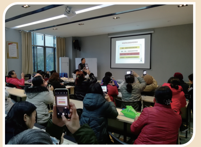
▲中医养生课一座难求