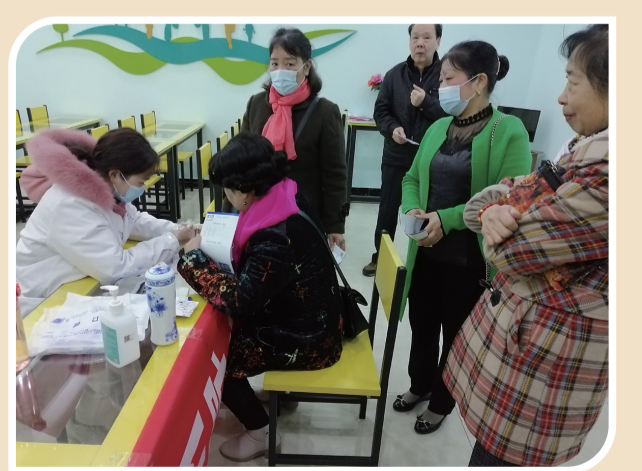
▲牙科义诊广受欢迎