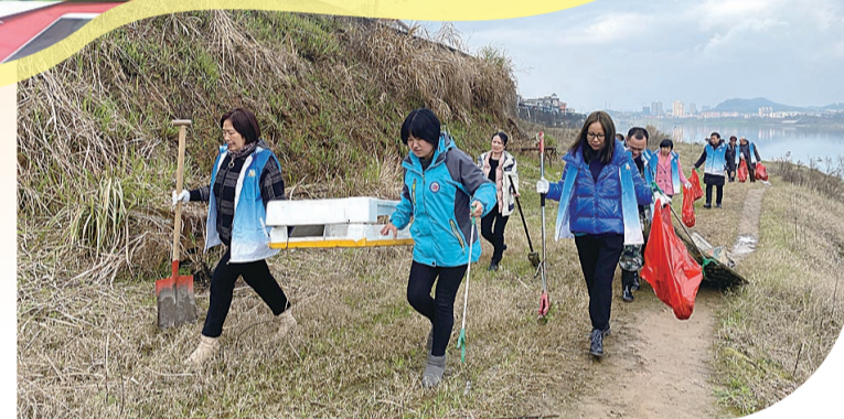
▶天元区志愿者开展湘江岸清理活动