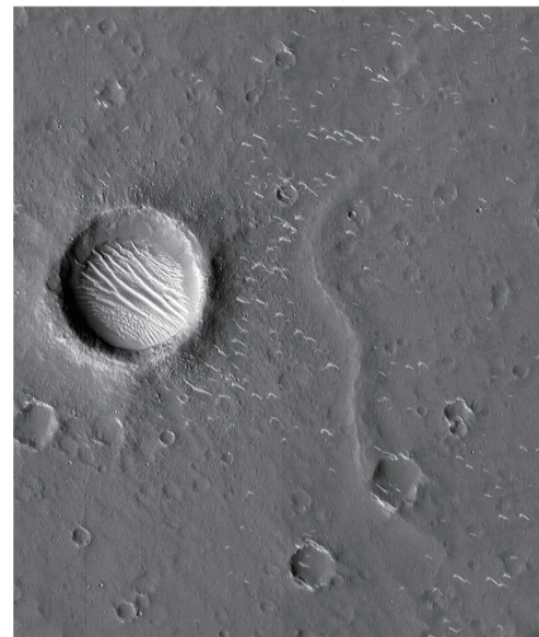
▲这是国家航天局公布的“天问一号”拍摄的高清火星影像图

3月4日,国家航天局发布3幅由我国首次火星探测任务“天问一号”探测器拍摄的高清火星影像图,包括2幅全色图像和1幅彩色图像。