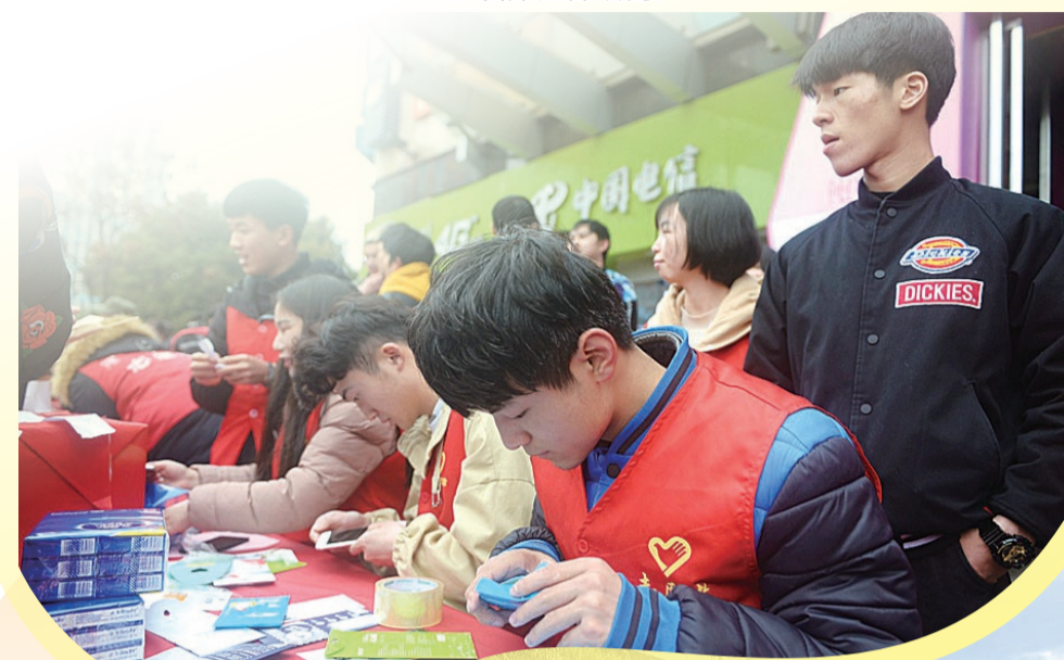
▲志愿者在街头开展志愿维修服务

去年,天元区的志愿服务创新做法,还作为基层治理新实践的典型被《人民日报》报道推介。