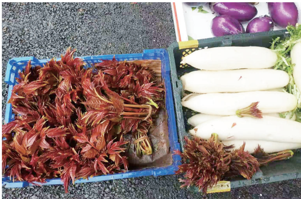
▲新上市的香椿

春天的气息越来越浓厚。吃春菜是民间迎春的一种民俗,被称为“咬春”“嚼春”。近日,“上海香椿卖到90元一斤”一度冲上热搜。株洲市场的香椿等春菜行情如何?3月3日,记者进行了探访。