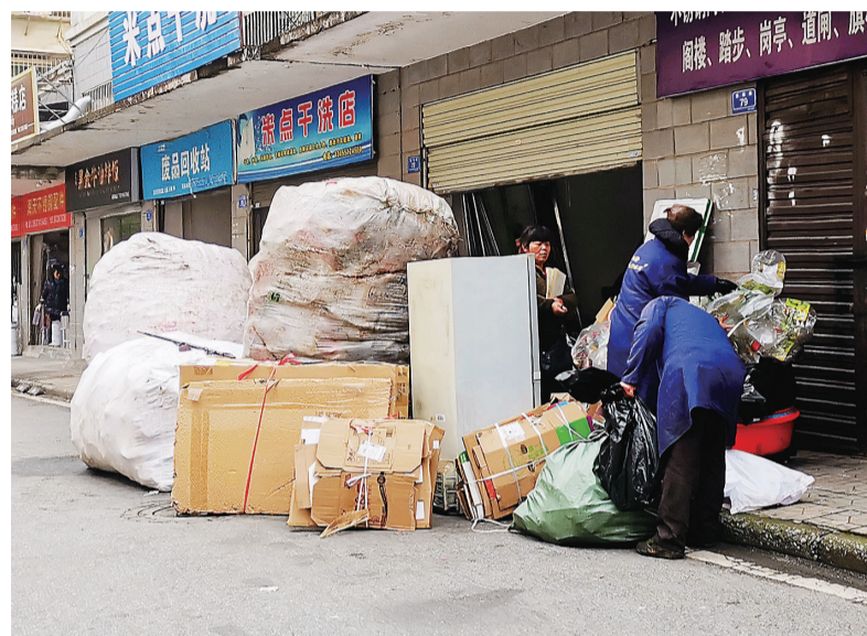
▲天元区一家废品回收站,工作人员在打包废纸

新学期刚开学,有的家长正以一种特殊的经历,“嗅”到了纸张涨价的气息。而记者带着这条线索走访发现,纸涨价的现象已经波及各个相关行业。