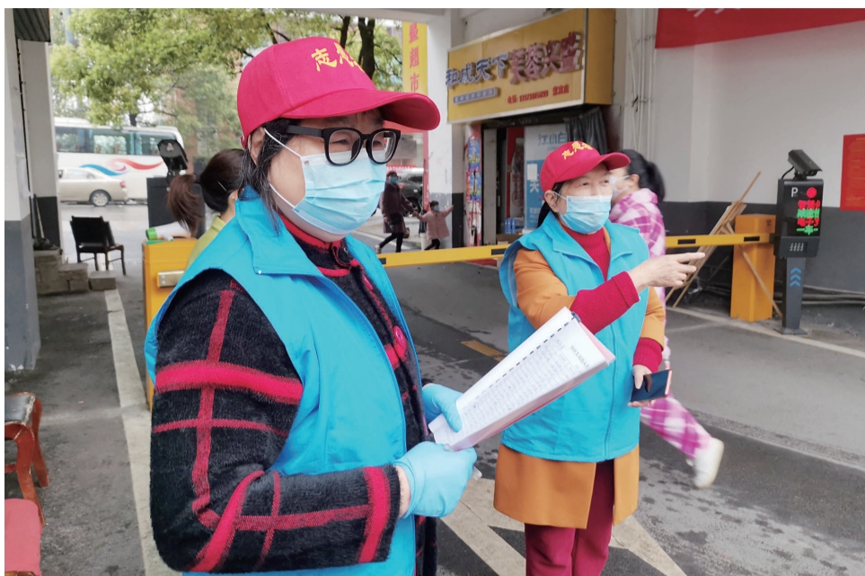
▲“邻里守望”活动中，小区志愿者参与社区防控

本报讯(记者 戴濂 通讯员 龙建清 卢宇辉)推进“雷锋家乡学雷锋·文明株洲我先行”志愿服务活动，弘扬雷锋精神