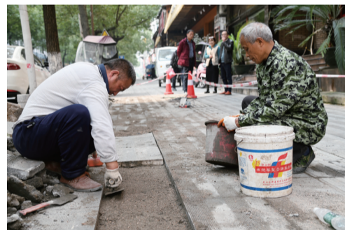
▲七一路沿线人行道修缮

本报讯(记者 伍婧雯 通讯员 谢翊)非机动车在人行道上乱停乱放、压占盲道，不仅违反《株洲市城市综合管理条例》，更给居民正常通行带来不便。