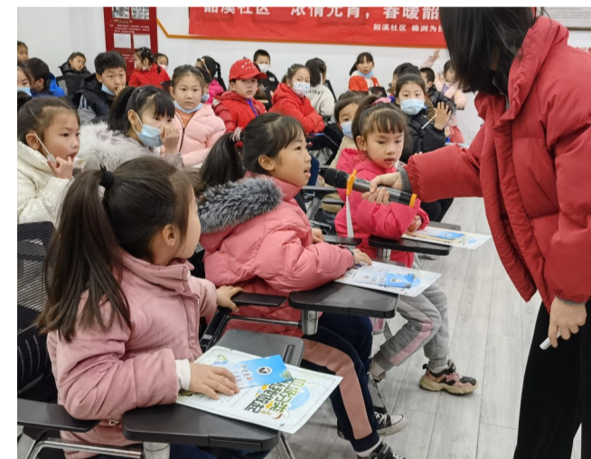
▲听故事,猜灯谜,孩子在寓教于乐中学习成长

猜谜有奖乐翻天。读完绘本故事,就到了下一个环节“猜灯谜”啦!“超级好牙刷(打一成语)”“骂不还口(打一动物)”,工作人员给各位小朋友精心准备了90多条具有知识性、娱乐性、趣味性的谜语,包括脑筋急转弯、字谜、成语等。谜语涵盖了民俗文化、廉政文化、孝老敬亲、绿色环保等方面的内容,有趣而通俗,面广而量大,激起了小朋友们的浓厚兴趣。小朋友们个个带着胜利的果实(小零食)开心而归。