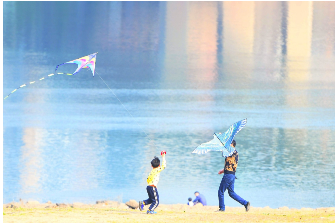
▲近日,河西湘江边,孩子们在温暖的阳光下拉着风筝飞快地奔跑着

每日金句 人生的能力是多方面的,但是如果失去了勇敢,所有的能力就都等于零。——爱默生