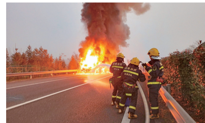
▲半挂车 火势猛烈,消防员正在灭火 通讯员供图

本报讯(记者 刘奎 通讯员 陶广礼 王小庆)前日,武深高速收费站,一辆半挂车突然自燃,1公里外就能看到滚滚黑烟,火势随后被消防部门扑灭,没有造成人员伤亡。