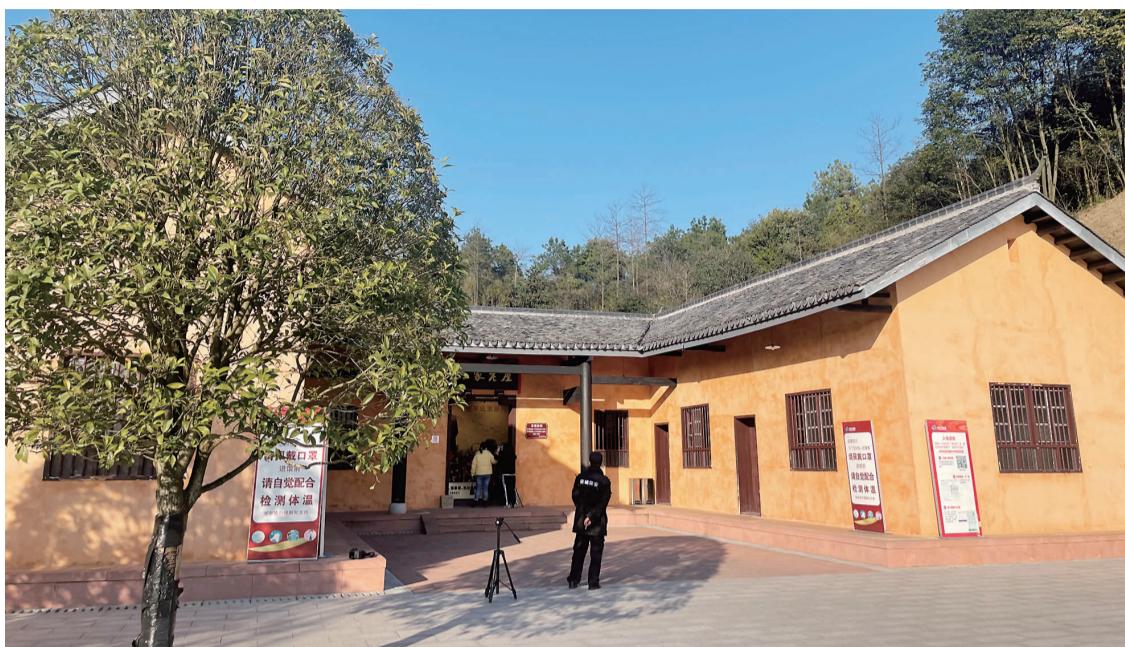
▲左家老屋

在左权牺牲一个多月后,《解放日报》刊登了刘志兰的悼念文章,同时,这也是她再也寄不出去的一封信。