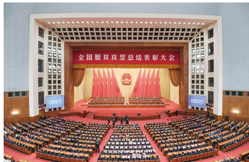
▲2月25日,全国脱贫攻坚总结表彰大会在北京人民大会堂隆重举行

习近平向全国脱贫攻坚楷模荣誉称号获得者等颁奖并发表重要讲话 李克强主持 汪洋宣读表彰决定 栗战书王沪宁赵乐际韩正王岐山出席