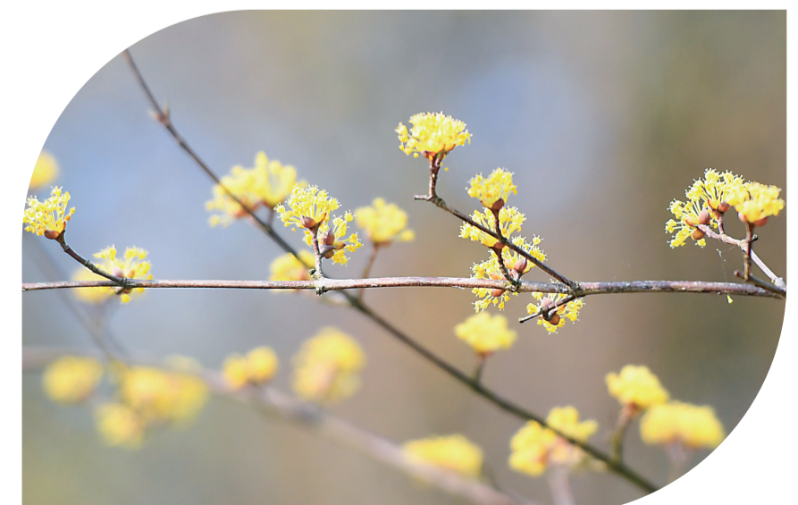
▲神农城的山茱萸也开出了小巧的花朵