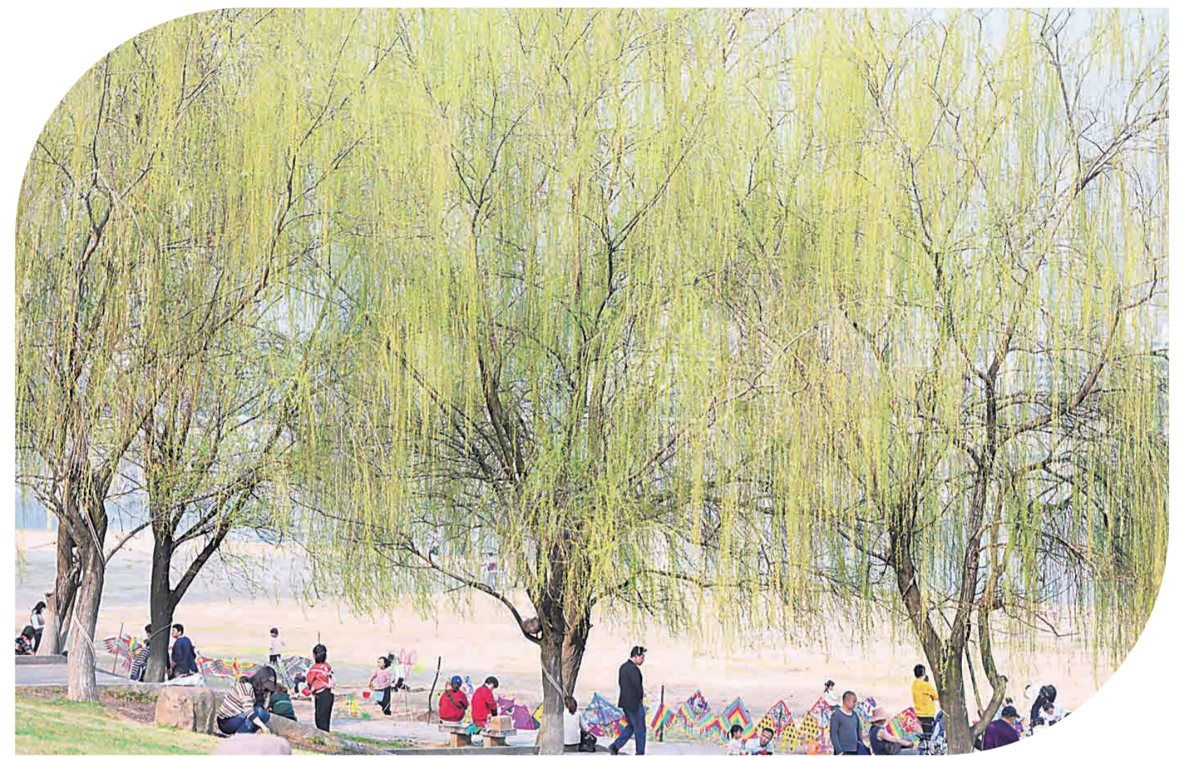
▲河西湘江边,一排排的柳树发出了新芽

六、联系方式: 株洲绿建新材料科技有限公司 何先生:0731-27689579 株洲市产权交易中心有限公司 方先生:0731-28685728 株洲市产权交易中心有限公司 2021年2月25日