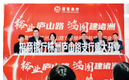
▲招商银行株洲庐山路支行盛大开业现场

新年焕新颜,24日上午,招商银行株洲庐山路支行全新启航,这是招行在株洲打造的第三家集“金融+科技+生活”于一体的智慧型3.0网点,将点亮全新的智能化金融服务。