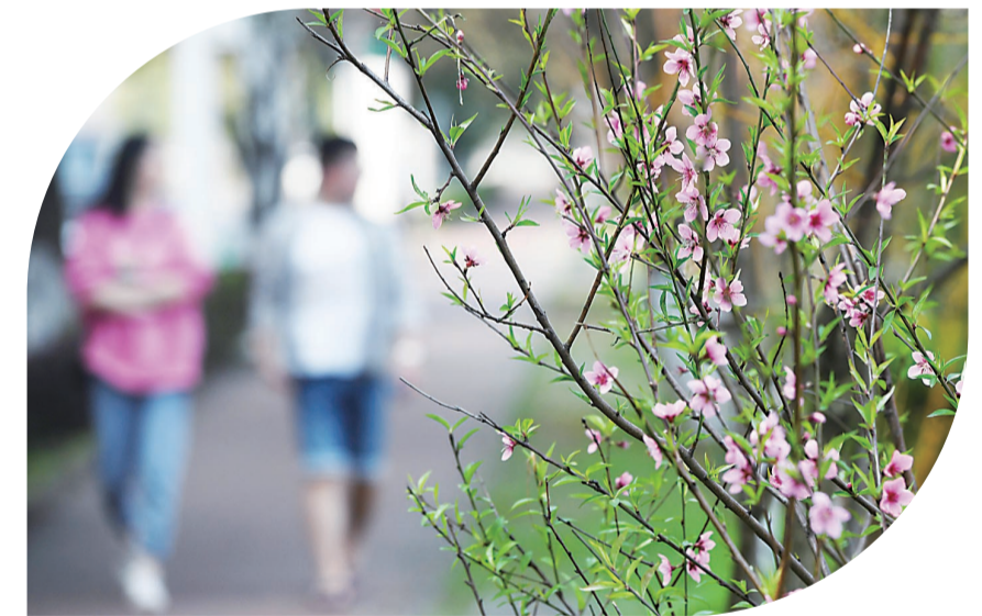
▲滨江路逐渐绽放的桃花