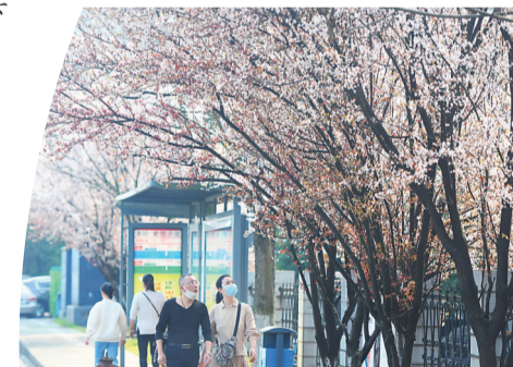
▲天元区家园小区公交站台被开满花朵的树木装扮得特别温馨