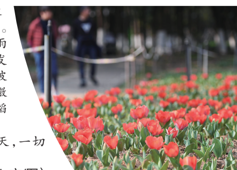
▲风光带钢琴广场附近的郁金香