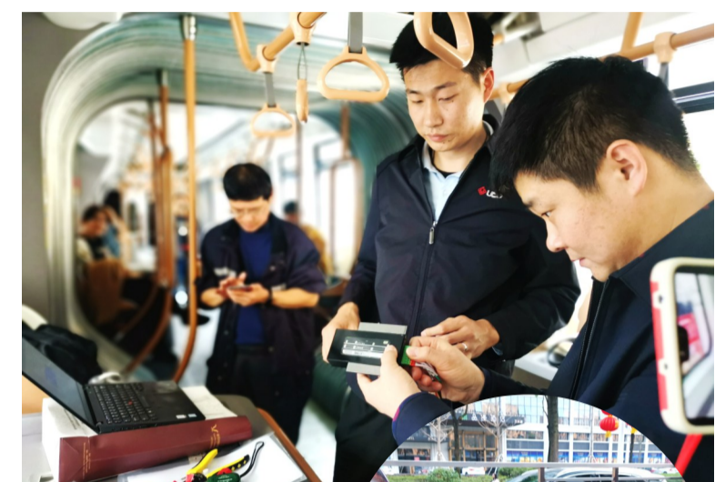
▲工作人员正在调试设备

本报讯(记者 戴凛 通讯员 夏四亮)记者昨日从市交通运输局获悉,智轨一期工程河西段站台装修和设备安装已基本完成,目前正在进行车、站、信号及与公交系统的联调联试。