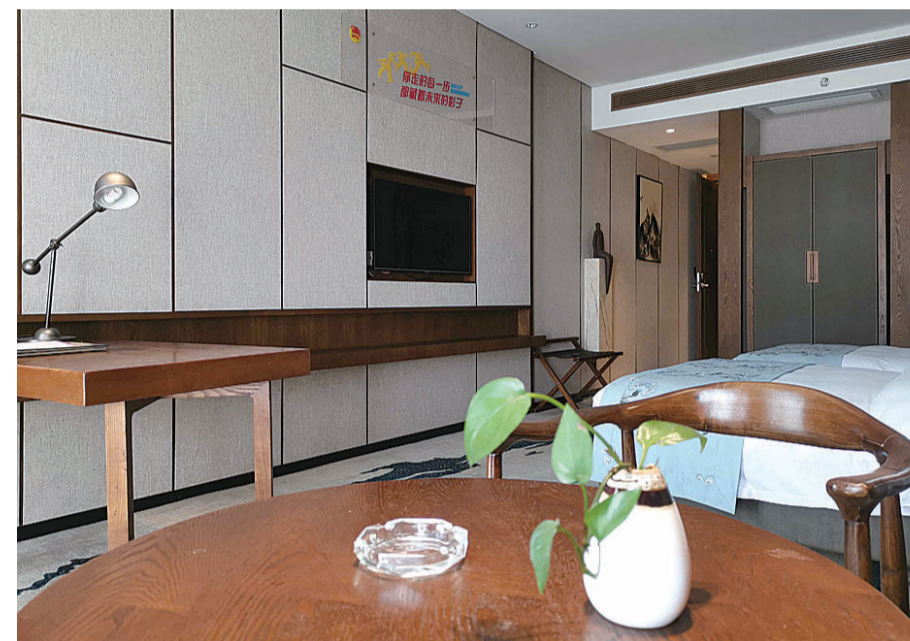
▲青年人才驿站内舒适温馨

本报讯(记者 戴凇 通讯员 李怡娟)记者昨日从团市委获悉,为帮助贫困未就业青年进城求职,株洲青年人才驿站面向来株就业的贫困求职青年,提供免费入住的服务。