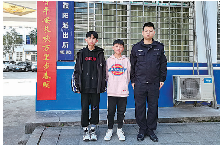
▲两个男孩在快餐店捡到钱包后,主动交给了警察叔叔

本报讯(记者 李卉 通讯员 刘沛萌)春节期间,炎陵县公安局霞阳派出所接连处理了两起市民捡到现金后主动报警的事件,民警同志想为几名拾金不昧的孩子点个赞。