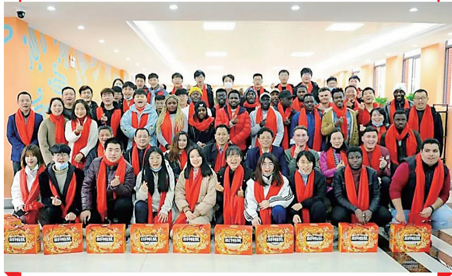
湖南工业大学留校学生的“全家福”。