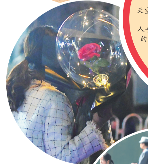
▲2月14日情人节，街头洋溢着浪漫的气息