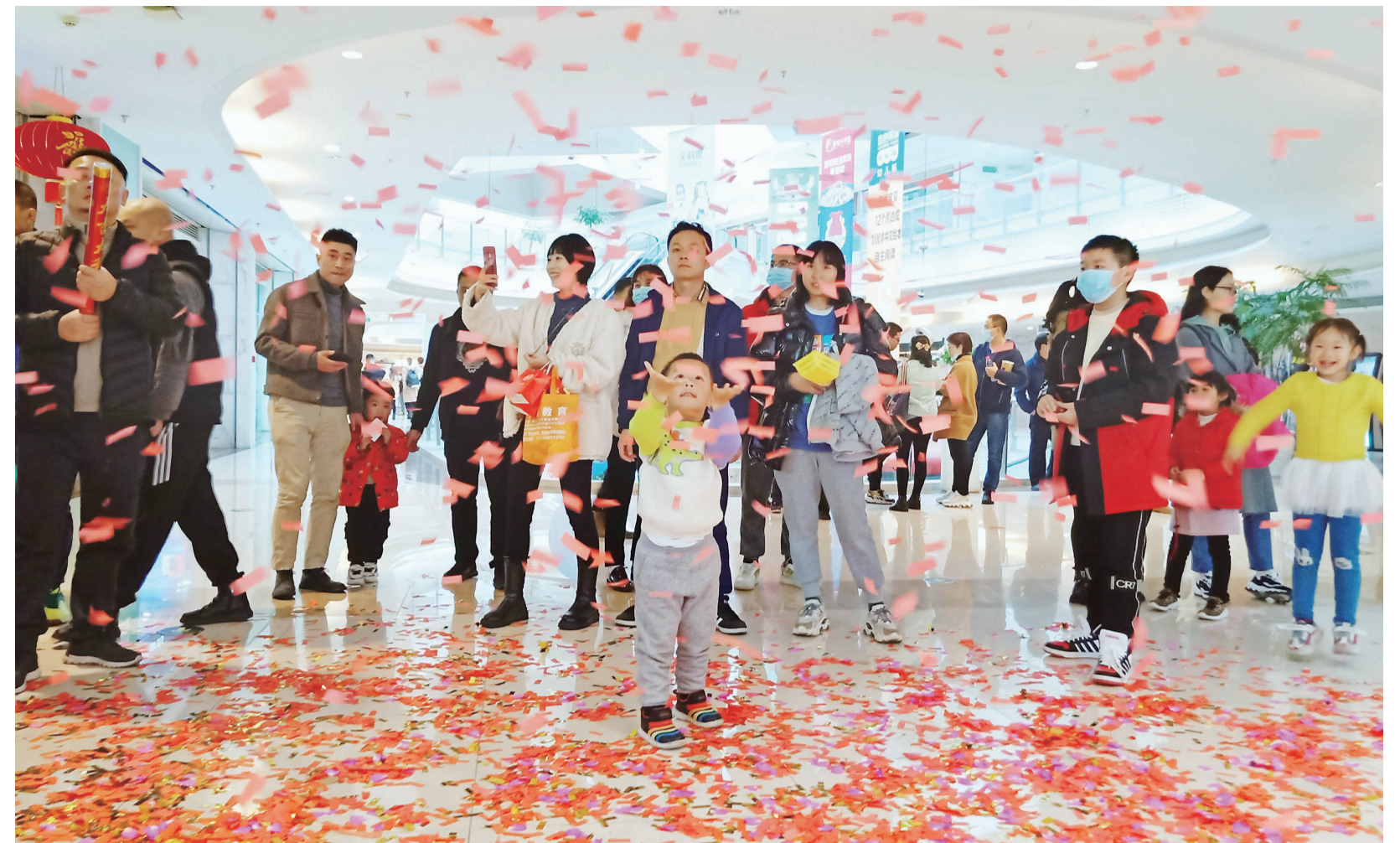
▼孩子们在万丰湖沙滩上开心地玩沙子

丁元春介绍，目前周阿姨的小儿子建武的情况已经趋于稳定，通过社区、志愿者们的联系对接，医生也几次上门，为大儿子建军清理患处，同时进行专业判断，帮助他进行残疾评定。同时社区与区残联、区民政、养老服务机构等密切沟通，将积极采取措施，齐心协力帮助周阿姨解决急难问题。 (记者 李卉 通讯员 周郁 陈文相)