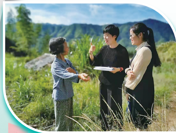
▲2020年9月,市妇联开展组织改革“破难行动”专题调研,调研组在炎陵县策源乡梁桥村与乡镇妇联主席走进普通农户家庭了解生活情况