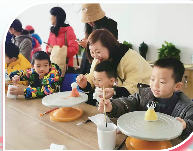
▲2020年12月25日株洲市妇女儿童活动中心竣工启用,家长带着孩子们在中心参加体验活动