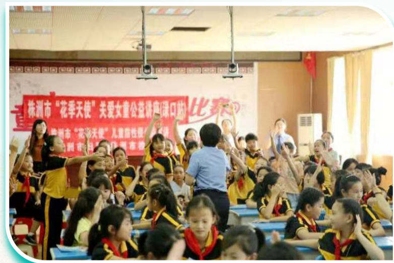
▲2020年1月,市妇联联合市检察院、市妇幼保健院等部门在全省率先启动“花季天使”关爱女童、预防性侵公益项目,志愿者老师为涪陵区红军小学二年级的学生讲授《保护我们的身体》