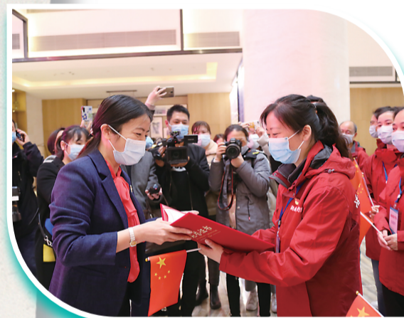
▲授予51名援鄂女性医务者“株洲市三八红旗手”荣誉证书

拨付资金20万元到攸县上垅村。每月组织机关干部开展走访慰问,帮助9户贫困户成功脱贫。