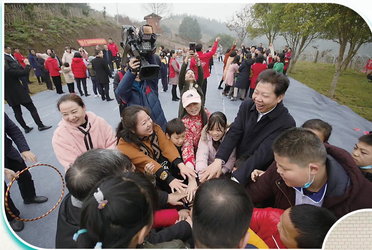
▲2020年12月12日,省妇联党组书记、主席姜欣,市委书记、市人大常委会主任毛腾飞参加“我们在一起”爱心妈妈与留守儿童拓展迎新年活动