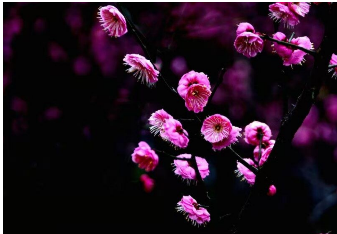
▲近日,河西风光带五桥附近的梅花盛开,香气四溢,吸引了不少市民驻足赏花