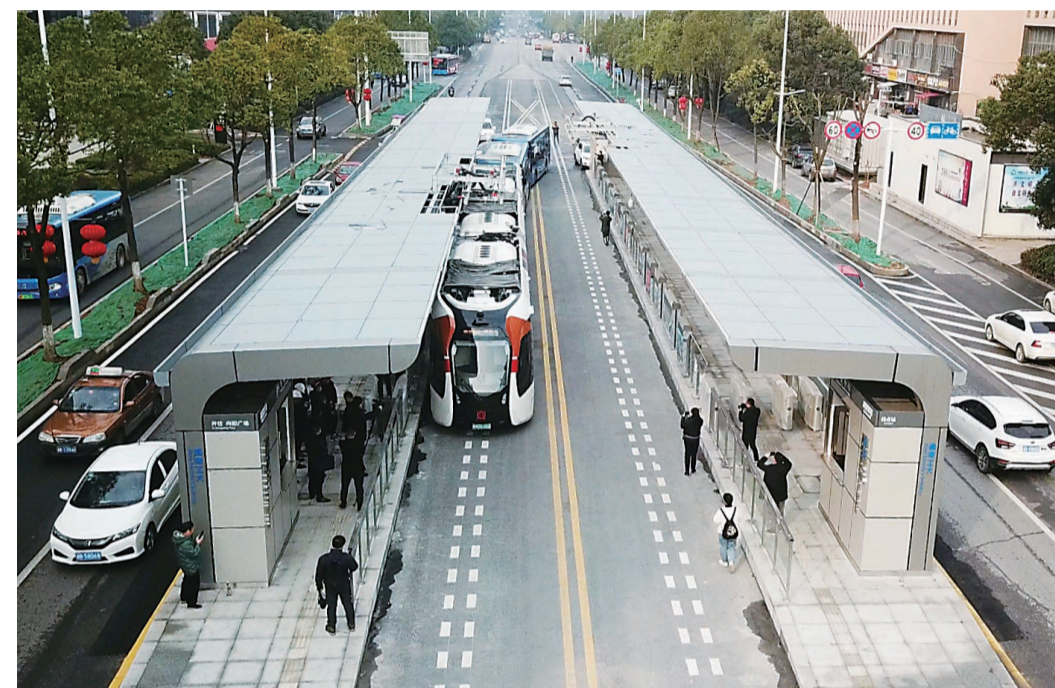
▲智轨列车“身后”,还有普通公交参与测试