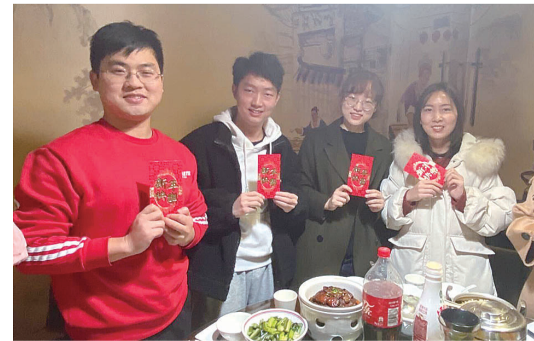
▲2月4日,菱溪中学组织4名外省教师一起过小年