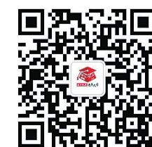
▲株洲晚报老年大学微信公众号