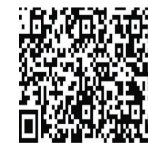
▲晚报乐活周刊微信群