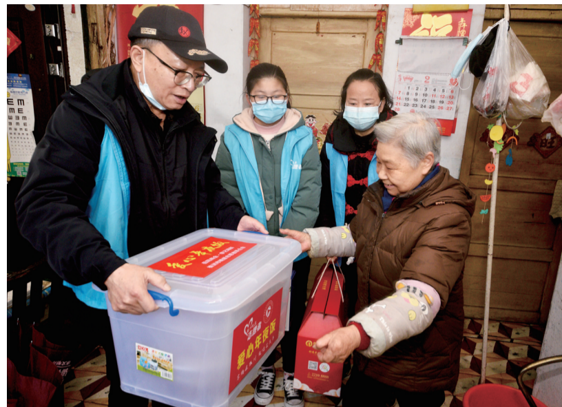
▲志愿者为特殊家庭送去“爱心年夜饭+年货”