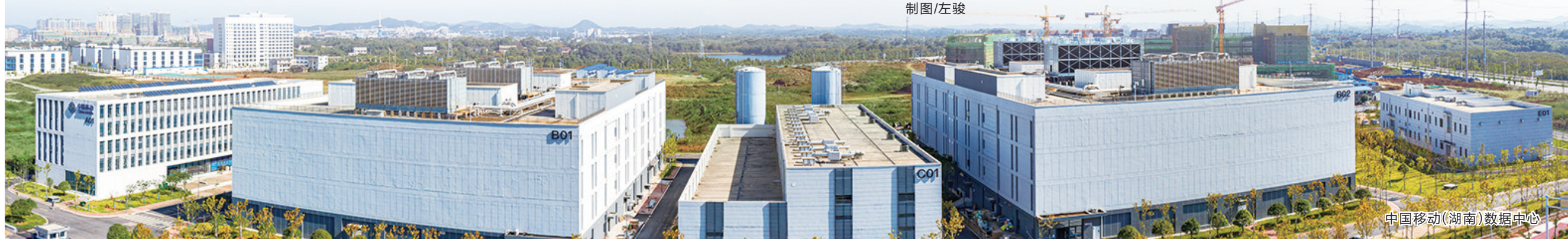
中国移动(湖南)数据中心