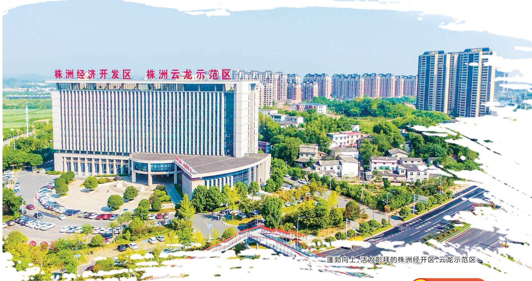
株洲经济开发区 株洲云龙示范区