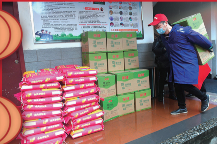
▲部分爱心年货送达社区,由工作人员送至特困群众家中