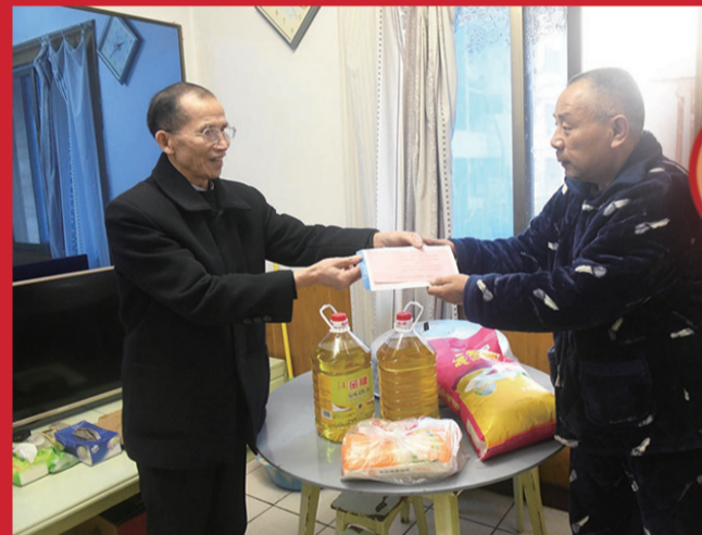
▲市福建商会相关负责人把年货送到特困群众家中