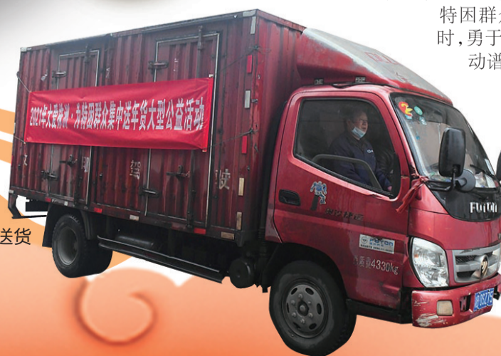
▶一辆辆装满爱心年货的车辆启程送货

特困群众中不少人在面对逆境时,勇于向前,勇于坚持,用实际行动谱写着人间真爱;爱心单位、爱心个人不遗余力对这些特困群众给予帮助,让特困群众的新年,过得更祥和。爱,溢满株洲。