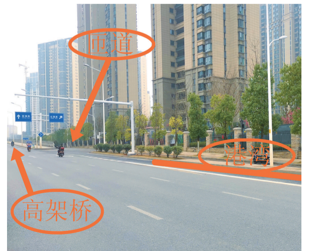
▲被取消的规划港湾站示意图

采访中,多位附近居民表示,希望相关部门进一步协调,争取在沿线其他位置增设站点,方便周边住户出行。