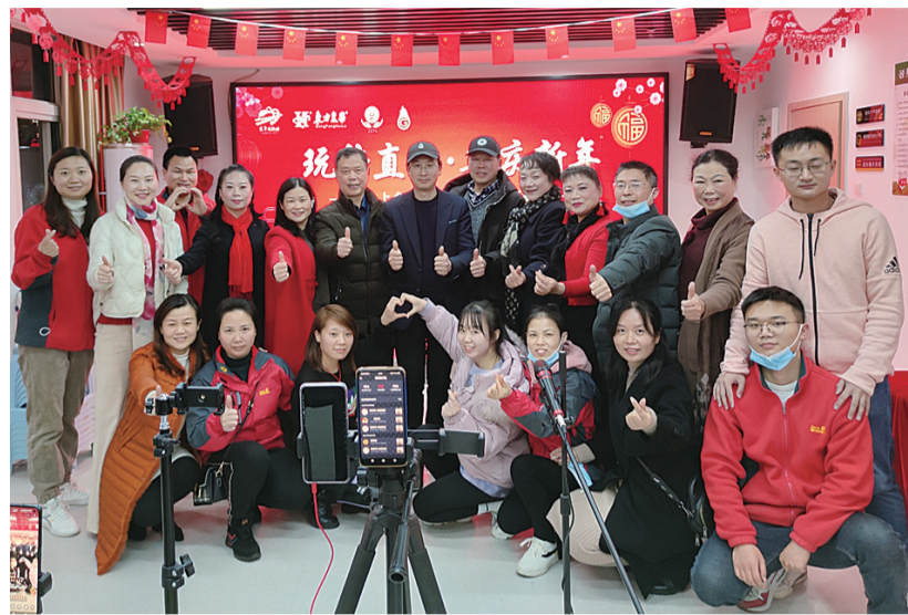
▲响石岭街道新春嘉年华线上直播活动工作人员合影

“活动让大家收获了快乐,对于我儿子来说,更是一次心灵的跨越、一次成长的体验,感谢你们……”近日,石峰区响石岭街道收到了一封辖区居民的千字长信,信中流露的母爱让人动容。街道负责人表示,居民们这份信任是对他们工作的最高褒奖。