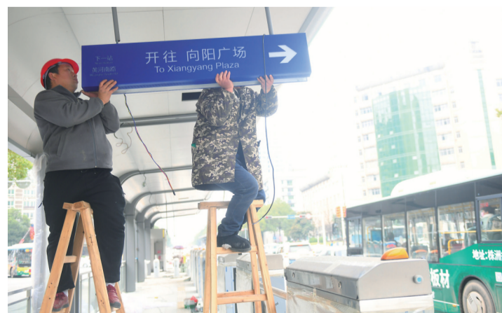
▲1月29日,珠江南路站,两位工人正在安装指示牌

道路千万条,安全第一条。 送孙子去参加课外培训的老王:过年期间运行就可以了,届时定会带上孙子,一起去感受株洲科技力量,正好要他写篇“我的株洲”作文。 施工方——北京城建工程部负责人:智轨列车一般按照试运行、试运营、运营三个阶段实施。目前,基础建设工程已基本完成,接下来还需要逐步进行车辆、廊道、站台设施、智控系统联调联试。工程竣工验收后将召开专家评审会对整个智轨一期进行评审,在得出本条线路具备载客条件之后,市民才能搭乘智轨列车。 (记者 何春林/文)