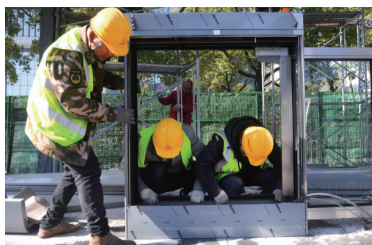
▲1月13日,工人在安装站台安全自动门