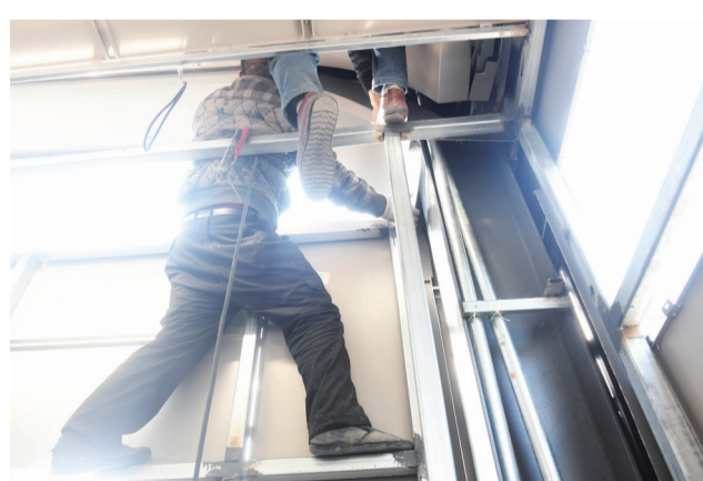
▲每一个细节都离不开工人的辛苦劳动