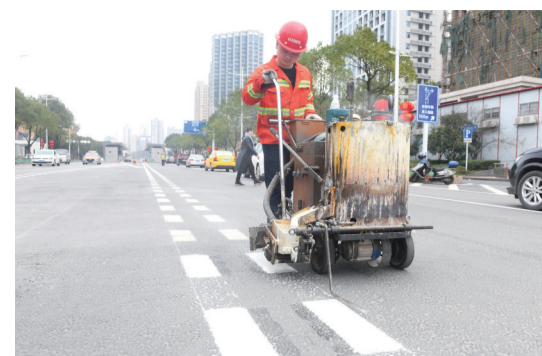
▲压制智轨专用道虚线