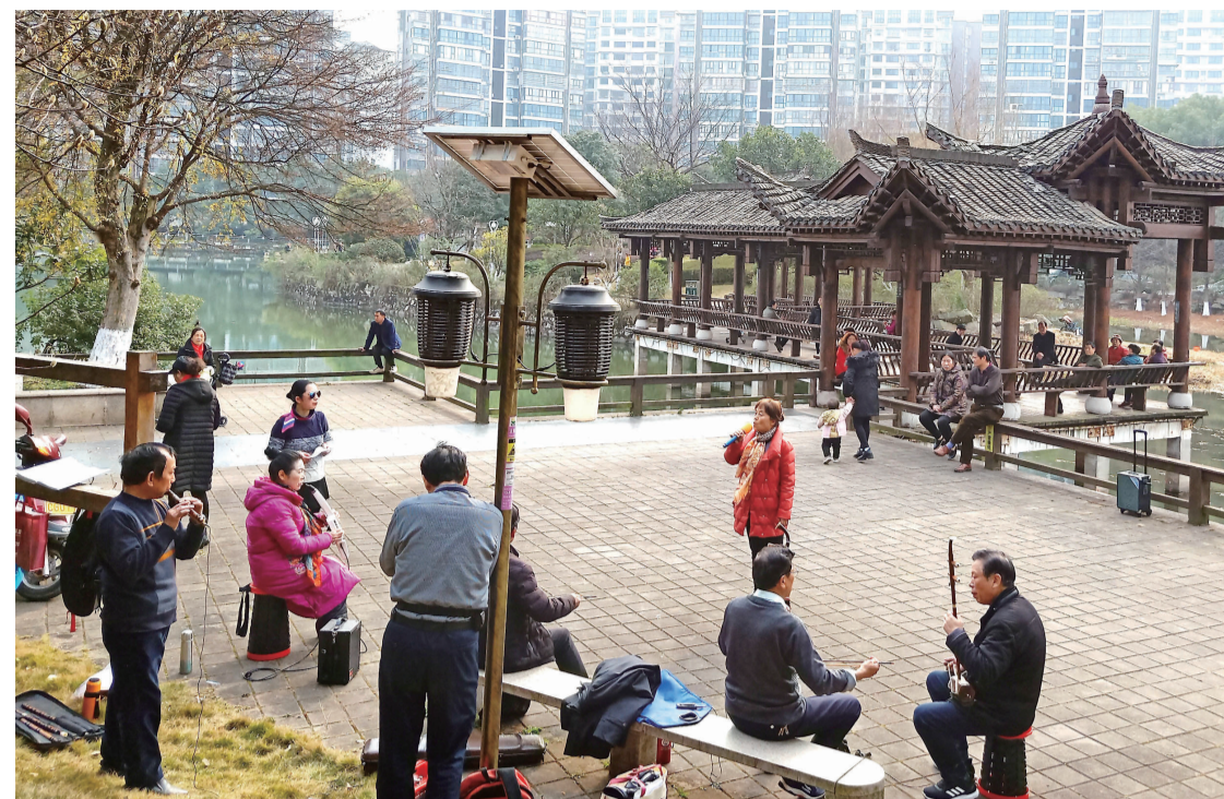
▲近日,温暖的天气里,市民在天鹅湖公园里吹拉弹唱,甚是惬意

每日金句 失败往往是黎明前的黑暗,继之而出现的就是成功的朝霞。——(美国)霍奇斯