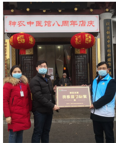
▲授牌现场

本报讯(记者 姚时美 通讯员 陈昭丽 言广南)1月26日,天元区委宣传部、天元区市场监管局对该区28家爱心商家授予“新区志愿贡享爱心商家”牌匾,标志着该APP已经对外开放,志愿者可用积分在这些商家兑换相应商品及服务。 据介绍,为大力弘扬“奉献、友爱、互助、进步”的志愿服务精神,整合各方资源、调度各方力量为志愿服务提供贡享支持,营造“新区有梦、天元有爱、志愿有我”的志愿务社会氛围,培育和践行社会主义核心价值观,促进社会文明进步,天元区推出新区志愿APP贡享超市。志愿者在开展志愿服务后,可以获得相应积分,在该APP上注册后,可以认定积分,而在贡享超市中选择的相应商品和服务,可以用这些积分兑换。