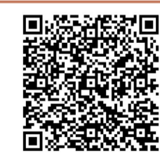
▲晚报乐活 周刊微信群