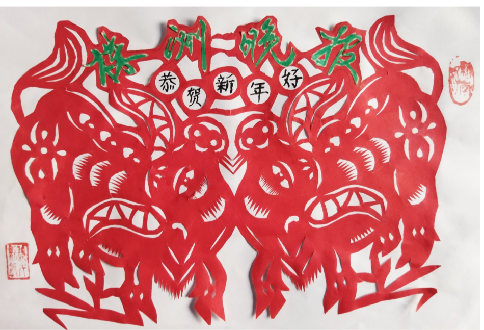
▲剪纸:《株洲晚报恭贺新年好》(作者:师才俊)