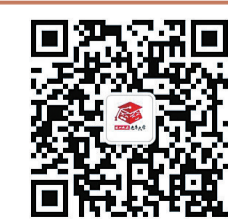
▲株洲晚报老年大学微信公众号