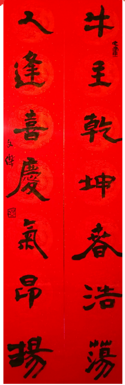
▲隶书:春联一副(作者:言文杰)