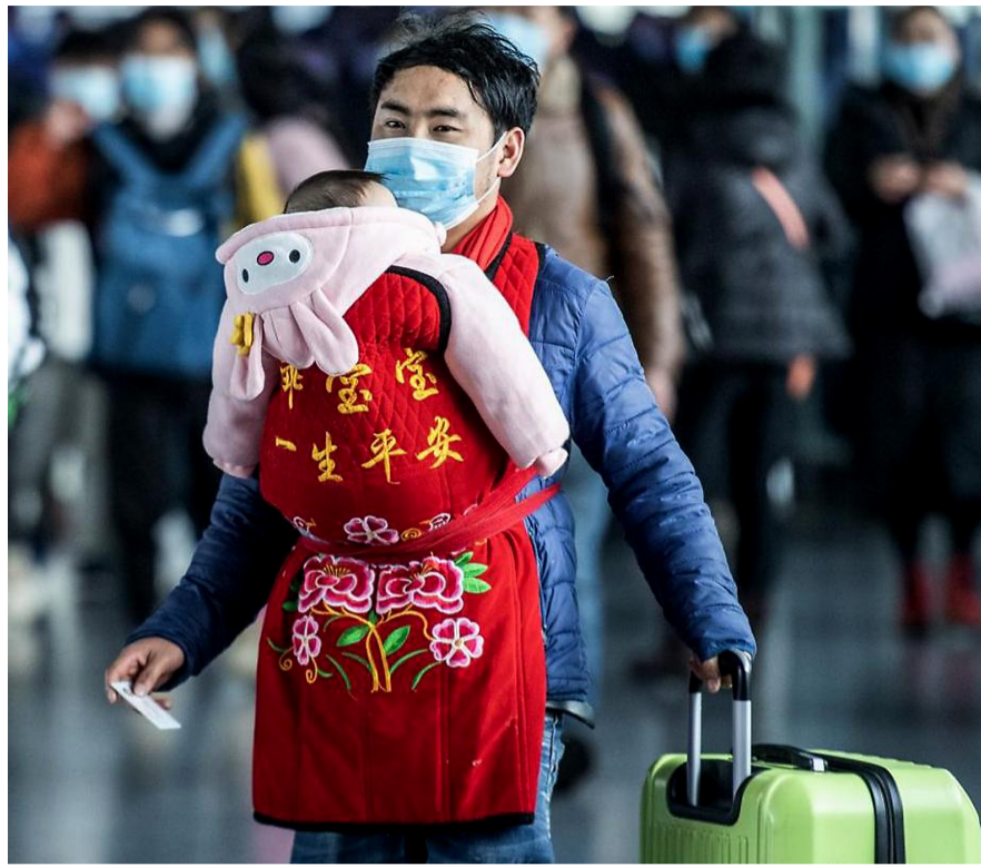
1月28日,旅客在贵州六盘水站进站乘车。

强化进出中高风险地区客运管控。指导各地交通运输主管部门特别是中高风险地区交通运输主管部门切实加强疫情防控措施,原则上暂停所有进出中高风险地区所在县级行政区域内的省际、市际客运班车、包车、跨城公交,以及出租汽车、顺风车跨城和城内拼车业务。