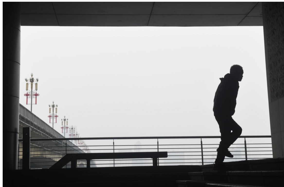
▲近日,雾霾笼罩的天气里,远处的美景成了灰白色