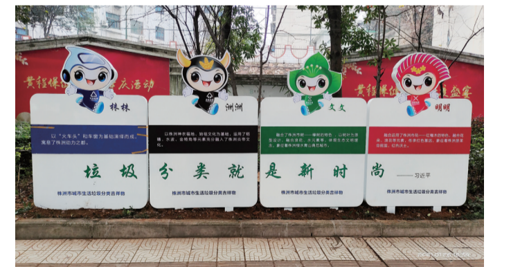
▲沿线布置了我们的垃圾分类卡通吉祥物、垃圾分类小提示标牌等