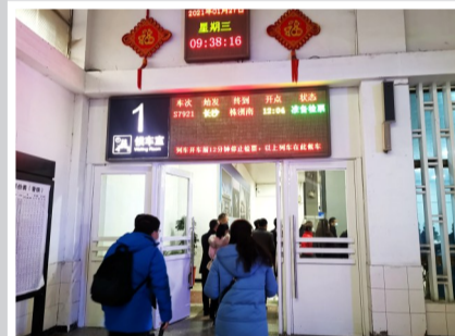
▲城铁株洲站的候车室为第一候车室 首席记者 戴凜 摄