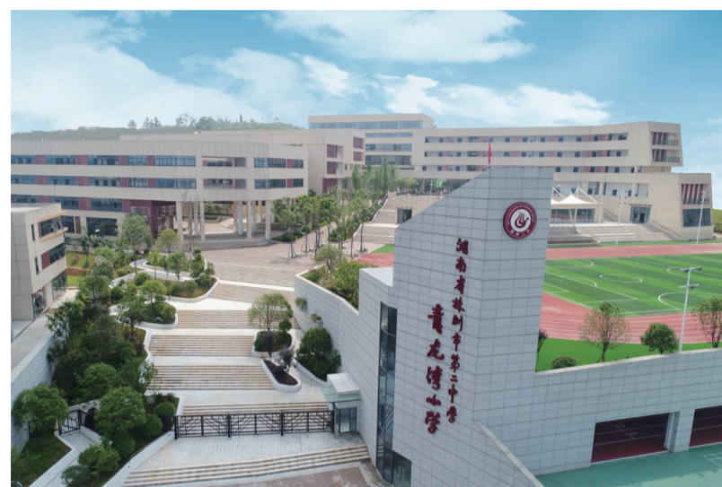
▲株洲市二中青龙湾小学

刚刚过去的2020年,对株洲房地产来说是极不平凡的一年,疫情给各行业带来一定的冲击,房地产行业也不例外。庆幸的是,青龙湾因凭借低密舒适、健康幸福的小镇生活方式,以及多元化高性价比的产品,受到株洲市民的追捧,不仅荣获株洲上半年的销冠,更以年销近2000套的销售佳绩,荣登株洲2020年年度单盘销冠。