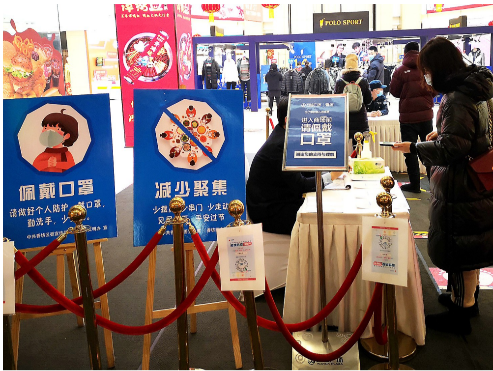
在哈尔滨市香坊区一大型超市入口处,市民在进行扫码测温(1月24日摄,手机照片)。