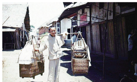
1946年,绿口镇上的小贩