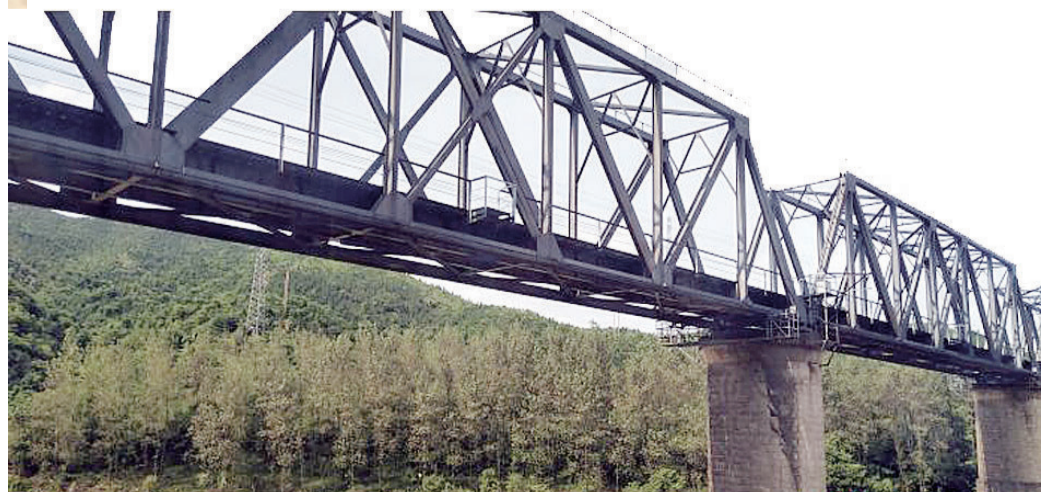
横跨沱江的湘东铁路茶陵段桁架铁路桥,是当年施工最复杂最难的工程之一。