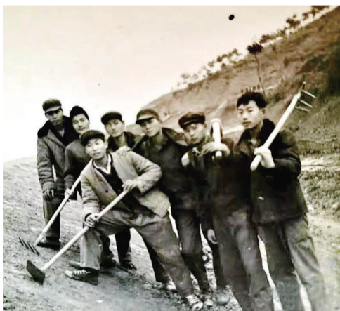
当年修建湘东铁路的部分民兵合影