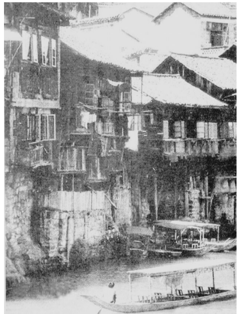
旧时绿江边的吊脚楼