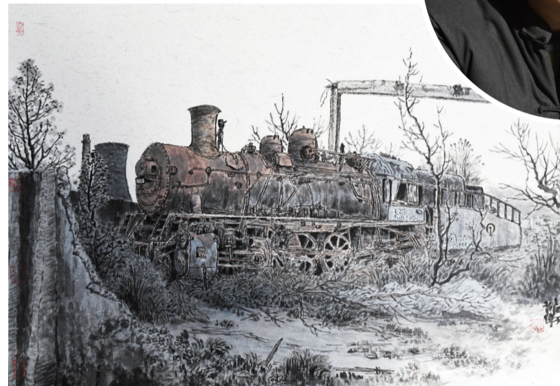
▲清水塘老工业区废弃的蒸汽火车