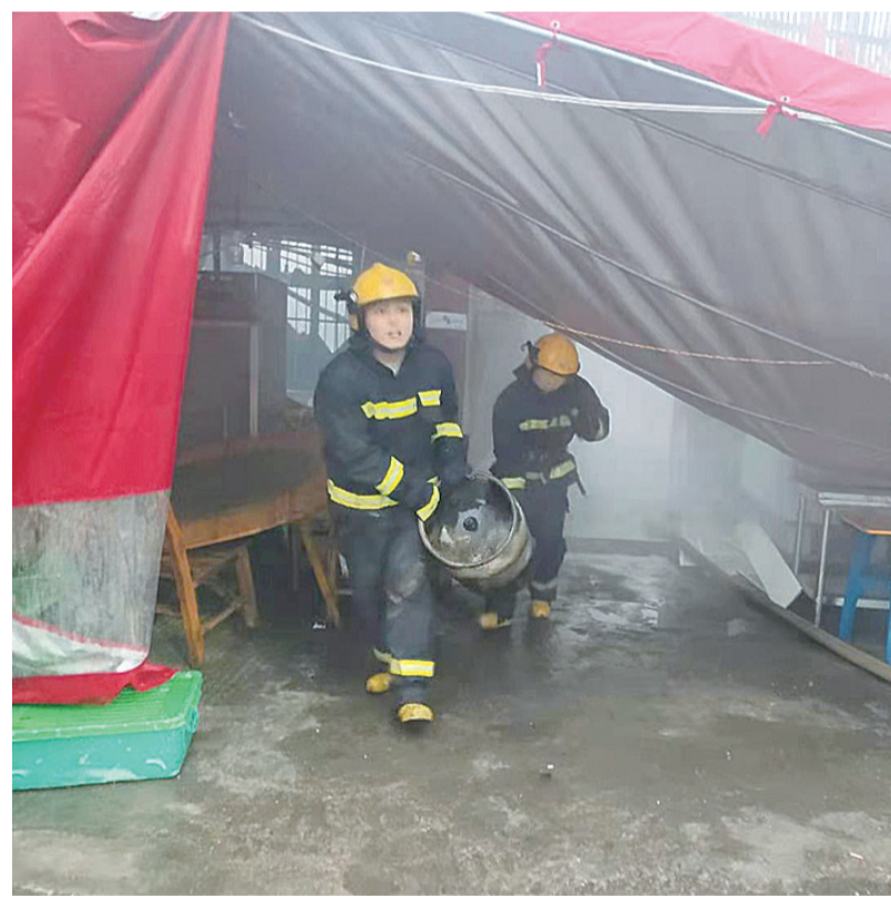
▲消防员将液化气罐安全转移

本报讯(记者 刘玺 通讯员 轩 述毅 陶广礼)1月22日清晨6时多,天元区月塘小区附近一饭店突然起火,虽然没有人员被困,但火场内存放了十个大型液化气罐,还好被消防员成功抢出。