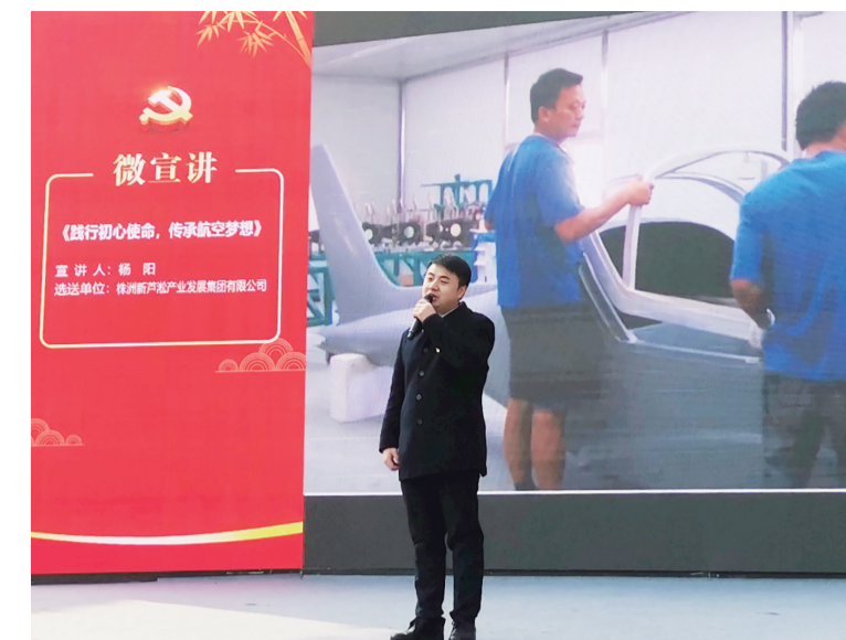
▲宣讲小分队队员作宣讲