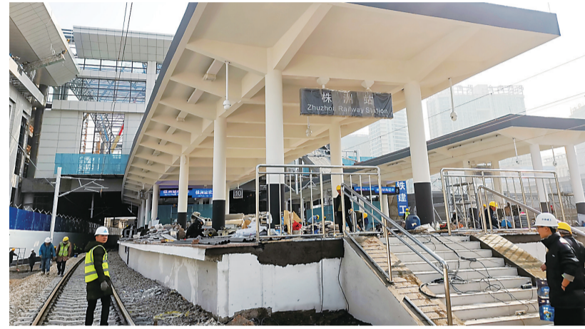
▲站内正加紧施工

本报讯(记者 戴凛 通讯员 夏四亮)再过几天,春运大幕将正式拉开。记者从市交通运输局获悉,长株潭城铁株洲站将于1月26日、27日启动试运行,并于1月28日正式投入运营,市民出行将更加便利。