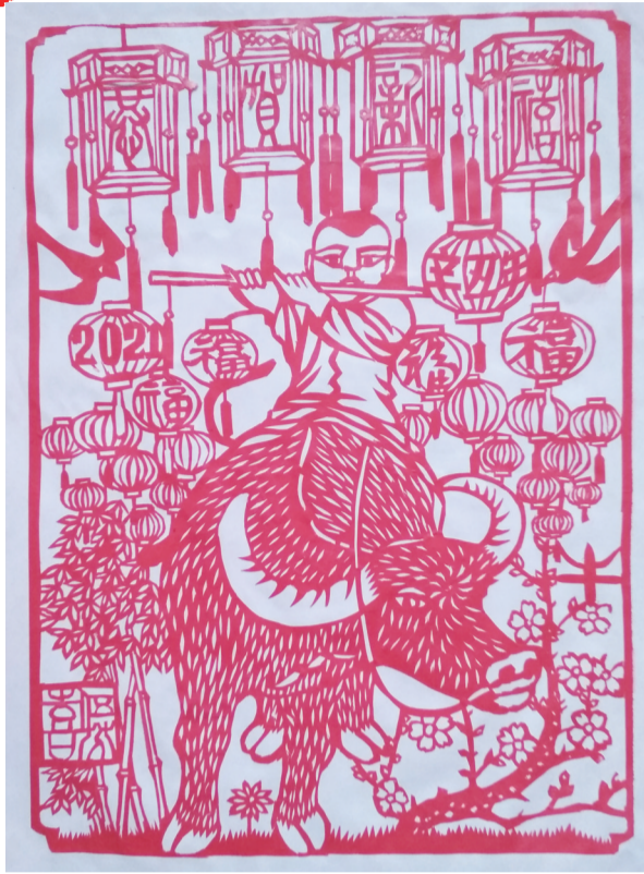
▲《恭贺新禧》(作者:伍芬喜)