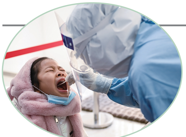
1月22日,小朋友在长春市朝阳区湖西街道开运社区核酸检测点进行核酸检测。