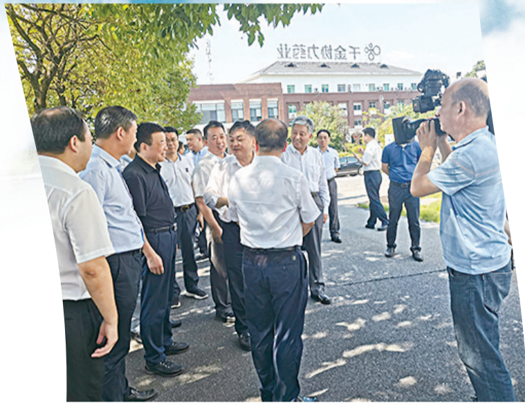
▲生态环境部部长黄润秋来株督查指导大气污染防治工作