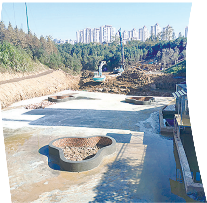
▲凿石港黑臭水体治理现场