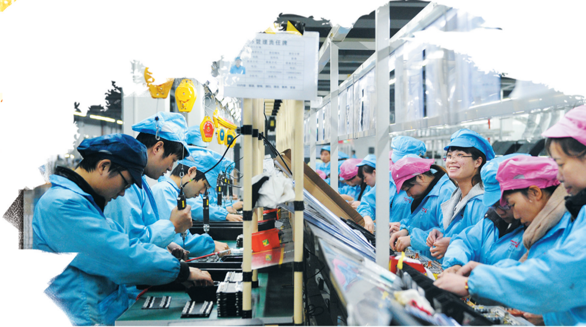
▲投产的长城电脑株洲基地。

这5年,奋进的株洲栉风沐雨,砥砺前行。这5年,满怀的豪情荡气回肠,硕果满枝。站在“十三五”收官的时间点回望,株洲经济社会早已发生了翻天覆地的深刻变化,站在了新的历史方位。 “十三五”时期,是我市工业发展历程中值得大书特书的5年,是市委、市政府运筹帷幄、科学决策、全力推进产业结构调整的5年,是新发展理念得到全面落实、产业体系得到革命性重塑、工业经济实现高质量发展的5年。 从老工业基地,到中国动力谷,市委、市政府运筹帷幄、科学决策,全市工业战线锐意改革、开拓创新,书写了华丽蜕变的现实答卷,为这5年写下战风斗雨的韧性,绘就凯歌以行的壮阔。