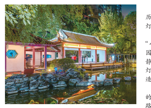
沈家湾社区怡心游园微亮化夜景

今年元旦假期的夜间,有着60年历史的铁冶生活区,深巷、弄道,小桥在灯光的映照下,熠熠生辉。在市民中心小游园,灯光把一朵朵“小蘑菇”映照在沙滩上,在罗家冲小游园“夜光小森林”里,附近居民尽享嬉戏与惬意;月亮投影、天鹅灯、萤火虫灯,创意灯光将湖南工业大学同创湖打造成了“最美灯光试验田”…… 曾几何时,在一些道路偏僻、狭窄的地段,在一些老旧小区,因为看不清路,居民尤其是老人晚上不敢出门。 而今,“微亮化”工程让昏暗街巷的居民们告别“摸黑”走路,安全感有了,心里踏实了,幸福感也有了。 “这样的微亮化,让老百姓心里感到很温暖。”居民感叹。 微做一片光亮,照出一方清明。这些亮起来的角落角落,让生活在株洲的人们感到温暖而安全。