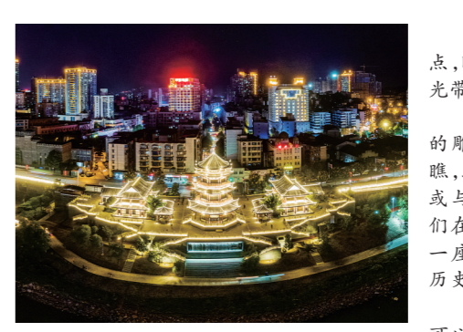
湘江东风风光带分号夜景

“留下记忆、记住乡愁”,彰显本色。城市历史文化遗存活着的历史,也是可以触摸的时代记忆。“十三五”期间,株洲大力推进历史建筑及历史文化街区保护工作,分批次、分阶段,实施神农架等8处株洲历史文化建筑保护,或远溯湘江史馆,或近溯株洲,或与人交谈谈论古今,人们在日常休闲生活中感受一座工业城市厚重的历史文化底蕴。 “通过一些东西还是可以找到历史的渊源,或是历史的文化,形成城市的自豪感。”一位市民说。