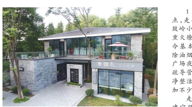
神农公园建宁驿站

1月9日晚上8点,走街探巷,在钟鼓岭小吃街,曾经烟火气的烧烤摊,如今基本户安装了除油烟设备。在东湖广场夜宵一条街,经城管管理后,摊位干净整洁,客流量也增加不少。 走累了,找一处建宁驿站,用用,看看,给手机充电,给茶杯加满热水,在这里温馨港湾歇脚再出发。