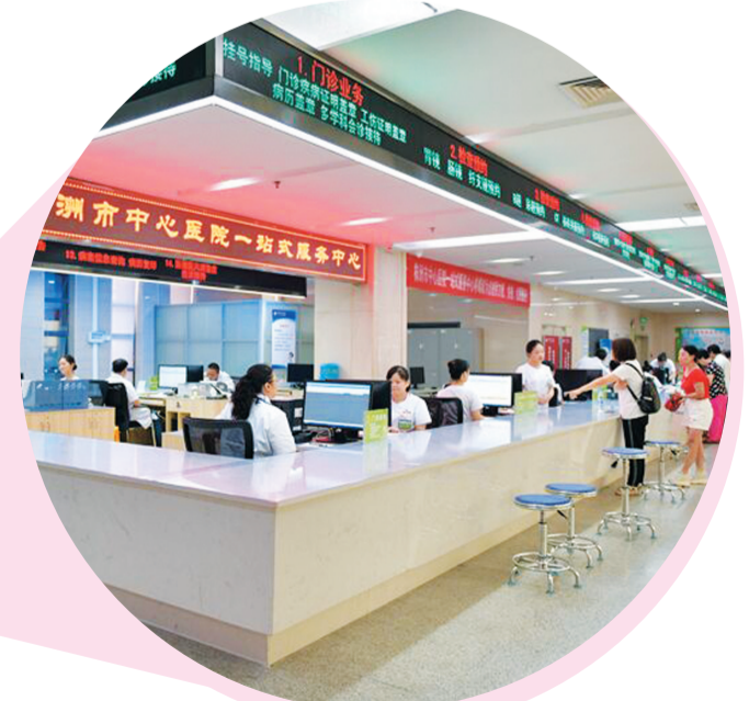
▲市中心医院一站式服务中心。