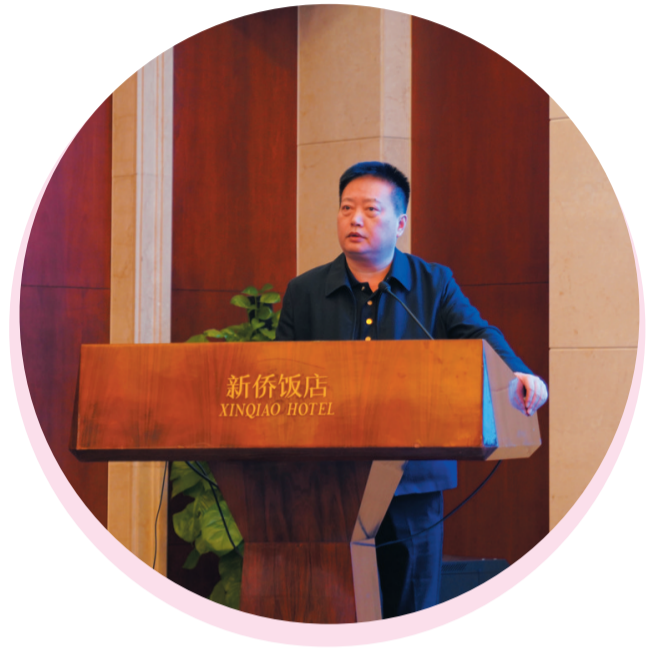
▲市中心医院院长蔡安烈在国家建立健全现代医院管理制度试点工作培训班(东片区)上进行典型经验分享。