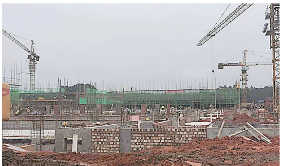
龙华农牧产蛋鸡养殖基地项目启动。

此次集中开工的项目有龙华农牧年出栏25万头产蛋鸡养殖基地、创新创业园二期、人民医院二期建设工程、中瑶110千伏输变电工程、智能遥控设备生产一期、砂石集散中心项目(河东区)、刘家冲林下经济种养综合体、竣工项目为果月食品项目(一期)、贝森有机硅建设项目(一期)、电机马达建设项目(一期)。