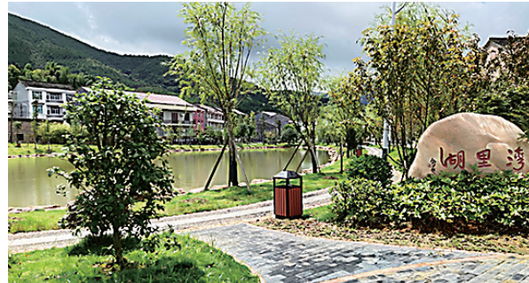
风光秀美的湾里村湾里湖

记忆中的湾里村只是一个小山村,泥巴路坑洼不平,旱厕臭棚随处可见,荒坡杂草丛生,透露着荒芜与凋敝。如今,人行绿荫里,恍在画中游。巨变的乡村迷住了过往游客的眼,也勾起了人们的乡愁。