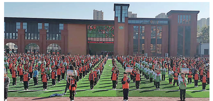
城北学校学生在新足球场上开运动会

近年来,茶陵县芙蓉学校一期正式投入使用,新建教师周转房和保障性住房280套,购买民办普惠性幼儿园园位1.1万个,增加公办园位1880个,义务教育大班额全面清零。人民医院二期、中医院二期工程有序推进,完成严塘、洙江、桃坑等5个乡镇卫生院提质改造。新增城镇就业2505人,“零就业家庭”动态援助年度完成率100%。