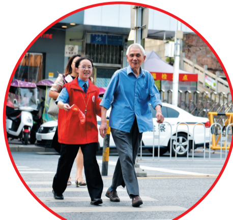
▲检察干警化身文明使者,街头护送老人过马路