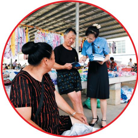
▲在执法中抓好普法,检察干警深入市场宣传《民法典》

来。最核心的举措要数“确定量刑”,市院成立量刑指导委员会,对于一些量刑情节复杂的疑难复杂案件通过委员会进行统一量刑精准化指导,提升量刑规范化水平,实现量刑均衡、同案同判,以解决少数量刑建议不准确、幅度量刑刑区间过大等问题。 桃李不言,下自成蹊。2020年以来,全市检察机关认罪认罚适用率为90.96%,确定量刑刑建议提出率为83.15%,均位居全省第一;确定量刑刑建议采纳率稳定提升,达到93.9%;全市认罪认罚案件上诉率逐年下降。