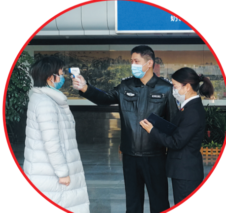
▲守土有责,检察干警认真开展疫情防控工作