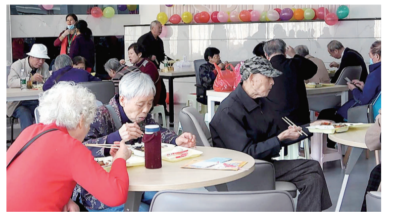
天元区长者餐厅体验日。