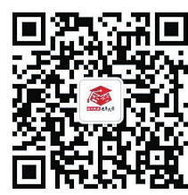
▲株洲晚报老年大学微信公众号

庚子年十二月初五 2021/01/17 星期日 今日8版 株洲日报社主管、主办 国内统一刊号 CN43-0061