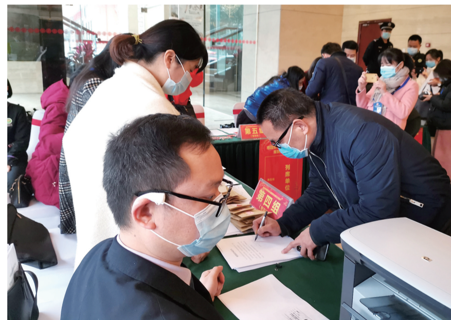
▲昨日,委员报到登记

本报讯(首席记者 戴凇)昨日下午,政协委员陆续来到驻地报到。在接下来的几天里,他们将积极建言献策,传递群众心声,履行政协职能。