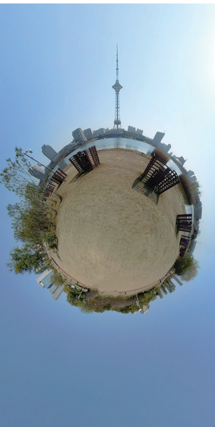
▲《神农城掠影》(作者:文捷环)