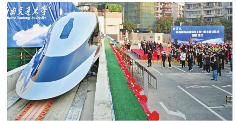
▲高温超导高速磁浮工程化样车及试验线亮相

本报讯(记者 伍靖雯 通讯员 曹书为)1月13日,世界首条高温超导高速磁浮工程化样车及试验线在四川成都正式启用,标志着高温超导高速磁浮工程化研究从无到有的突破。