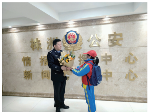
▲校园记者为民警叔叔献花、送贺卡

1月10日,是首个“中国人民警察节”,株洲日报社联合株洲市公安局举办了校园记者探秘警营系列活动。校园记者用献贺卡、做采访等独特方式,向民警叔叔阿姨表达敬意和感谢。