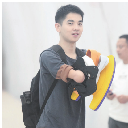
▲游泳运动让他们重拾信心